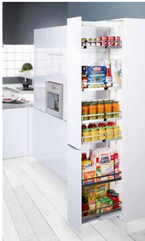
Oven mukana kokonaan ulosliukuva mekanismi.