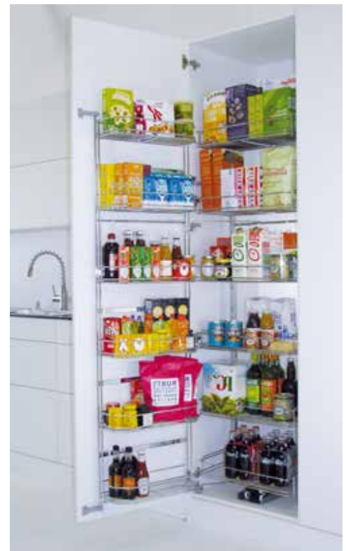
Aukeavan oven mukana liukuvassa vaunumekanismissa on ripaus arjen luksusta.