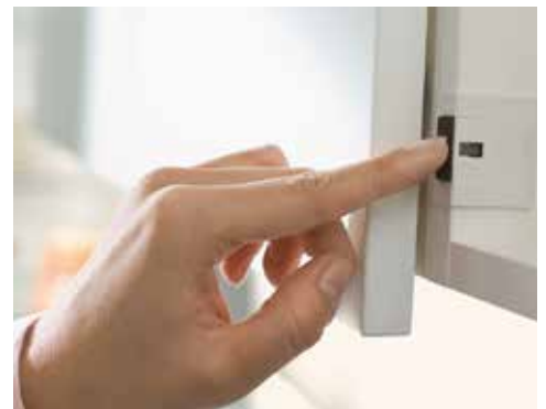
SERVO-DRIVE, MOOTTOROITU MEKANISMI

Sopii suurille seinäkaapeille, joissa on yksi iso ovi. Kätevän taittumismekanismin ansiosta tilantarve kaapin yläpuolella ei ole suuri.