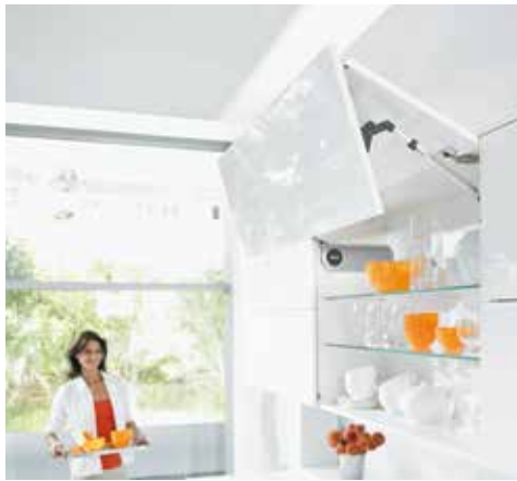
AVENTOS HF, KAKSIOSAISILLE OVILLE

Ihanteellinen valinta korkeille rungoille, koska vedin jää aina alas helposti tavoiteltavalle korkeudelle. Kaksiosaisen oven ansiosta tilantarve kaapin yläpuolella on varsin pieni rungon korkeuteen nähden. AVENTOS HF-mekanismia voidaan käyttää myös kahden erikorkuisen oven kanssa.