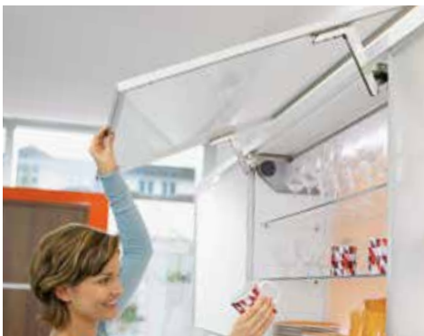
AVENTOS HS, KAAPIN YLI TAITTUVILLE OVILLE

Käytännöllinen mekanismi päällekkäin sijoitetuille tai upotetuille seinäkaapeille. Sopii mainiosti erityisesti mataliin kaappeihin.