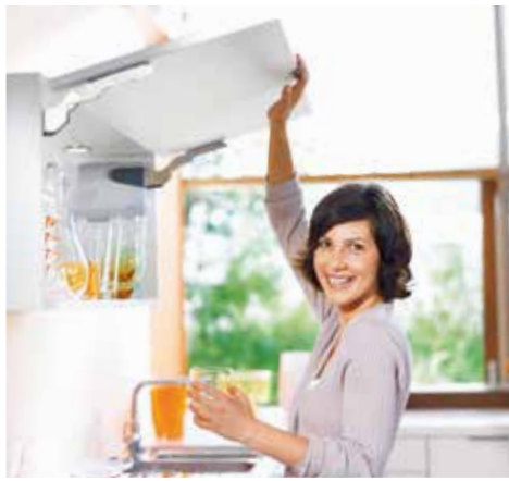
AVENTOS HK, YLÖS AVAUTUVILLE OVILLE

Ihanteellinen valinta korkeille rungoille, koska vedin jää aina alas helposti tavoiteltavalle korkeudelle. Kaksiosaisen oven ansiosta tilantarve kaapin yläpuolella on varsin pieni rungon korkeuteen nähden. AVENTOS HF-mekanismia voidaan käyttää myös kahden erikorkuisen oven kanssa.