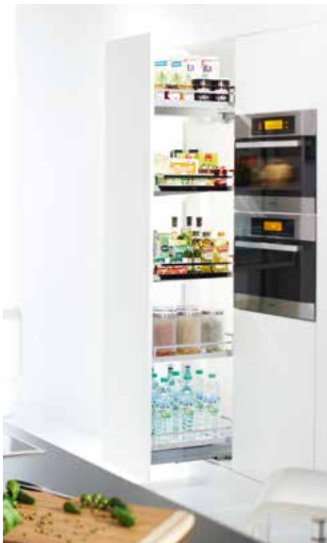
Convoy-mekanismissa yhdistyvät viimeistelty ulkonäkö ja loppuun hiottu käyttömukavuus.