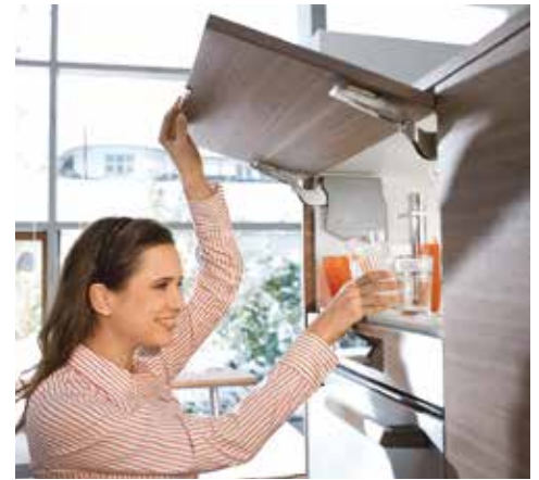
AVENTOS HK-S, PIENILLE YLÖS AVAUTUVILLE OVILLE

Toimiva ratkaisu etenkin matalille seinäkaapeille.