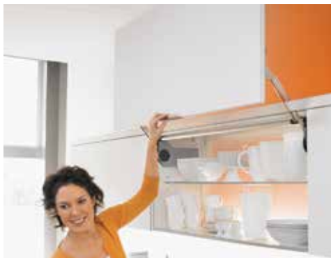
AVENTOS HL, SUORAAN YLÖS NOUSEVILLE OVILLE

Hyvä vaihtoehto pienille ylös avautuville oville esimerkiksi apteekkimekanismin tai jääkaapin yläpuolelle. Avautumiskulmansa ansiosta mekanismi vaatii hyvin vähän tilaa kaapin yläpuolella.