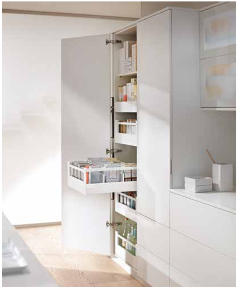
TANDEMBOX sisälaatikoilla saat korkean komeron tilan tehokkaasti käyttöön.